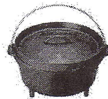
↑ダッチオーブンのパン作り